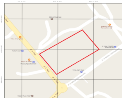
Gambar 2.1 Peta Lokasi Penelitian