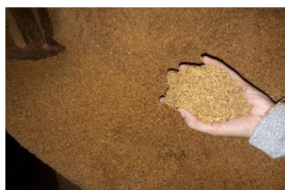
Gambar 1 Serbuk kayu ulin

Serbuk kayu ulin yang digunakan dalam penelitian ini berasal dari Desa Karang jawa, Kab Tanah Laut. Serbuk kayu ulin memiliki tekstur padat dapat dilihat pada Gambar 1 dibawah ini;