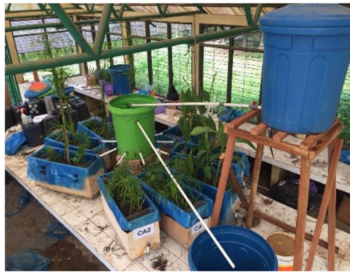
Gambar 1. Susunan Reaktor LBB-AHBP