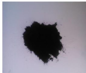
Gambar 2. Karbon Aktif B