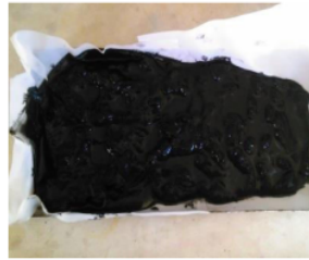
Gambar 1. Karbon Aktif A

Kadar air yang terdapat pada kulit Pisang kepok berkurang setelah dijemur, hasil ini akan membuat kinerja karbon aktif yang akan diolah akan lebih baik. Hasil karbonisasi kulit Pisang kepok menghasilkan karbon yang masih belum aktif. Karbon aktif kulit Pisang Kepok didapatkan setelah karbon diaktivasi menggunakan larutan H_2SO_4 .