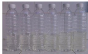
Gambar 5. Air Sumur Hasil Jartest dengan Karbon Aktif A

Nilai optimum untuk karbon aktif A terdapat pada dosis 10 gr/l dan untuk karbon aktif B pada dosis 5 gr/l karena nilai kandungan Mn yang terendah. Hal ini dapat dikarenakan luas permukaan adsorben kulit pisang Kepok yang cukup besar sehingga mengakibatkan penyerapan yang cukup banyak meskipun dalam dosis yang sedikit. Semakin banyak dosis yang digunakan, semakin rendah kapasitas adsorbsinya. Hal ini dikarenakan banyaknya dosis adsorben dapat membuat jenuhnya permukaan karbon aktif tersebut sehingga kapasitas adsorbsinya menurun.