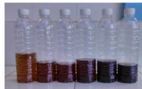
Gambar 6. Air Sumur Hasil Jartest dengan Karbon Aktif B

Dilihat pada gambar 6 warna air sumur setelah perlakuan berubah menjadi agak gelap, secara visual ini menandakan bahwa kandungan Fe dan Mn yang terdapat pada air sumur tersebut telah meningkat. Peningkatan kandungan Fe dan Mn dapat disebabkan oleh tingginya variasi dosis yang digunakan dalam penelitian ini. Penentuan variasi dosis didasarkan pada tingginya kandungan Fe dan Mn awal untuk penentuan lokasi pengambilan sampel air sumur. Adapun kandungan Fe dan Mn yang diuji sebelum melakukan jartest ternyata jauh lebih rendah dibandingkan uji awal.