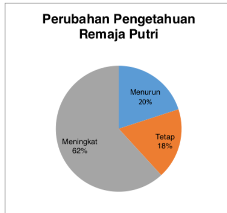
Gambar 5. Diagram Perubahan Pengetahuan Remaja Putri

Pada hasil keseluruhan pre-post test materi gizi seimbang diketahui sebanyak 11 orang atau 20% hasilnya menurun, sebanyak 10 orang atau 18% hasilnya tetap, dan sebanyak 34 orang atau 62% hasilnya meningkat. Adapun untuk responden yang nilainya menurun dan tetap diduga karena responden tersebut kurang membaca materi yang diberikan serta kurang memerhatikan diskusi yang berlangsung. Sehingga responden yang nilainya menurun hanya menjawab