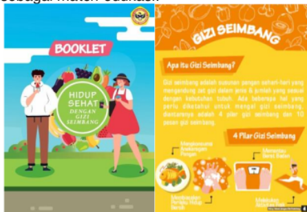
Gambar 2. Booklet Gizi Seimbang Hasil Pre Test dan Post Test untuk Mengukur Pengetahuan Remaja Putri

Berikut adalah booklet yang diberikan sebagai materi edukasi: