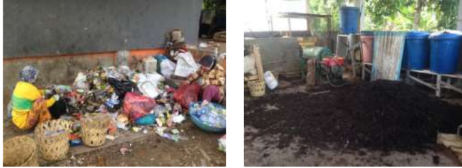
Gambar 1. Pemilahan Sampah dan Pengomposan di TPS 3R

TPA Basirih melayani pengelolaan sampah di Kota Banjarmasin. Di TPA ini belum ada teknologi untuk mengurangi sampah yang masuk ke landfill . Namun bentuk reduksinya berupa pengambilan sampah yang bernilai ekonomis oleh pemulung yang kemudian dijual ke pengepul yang ada di TPA tersebut. Kondisi sekarang pemulung dan pengepul ini masih belum ada pembinaan dari Dinas Lingkungan Hidup Kota Banjarmasin namun telah dilakukan pendataan. Jumlah pemulung di TPA ini yang terdata \pm 194 orang dan pengepul berjumlah \pm 9 orang. Menurut Mahyudin dkk., (2015) total sampah yang dapat dikurangi oleh pemulung di TPA Basirih sebesar 414 ton per bulan. Sampah yang memiliki persentasi pengurangan sampah yang tertinggi adalah sampah kantong plastik putih dan berwarna.