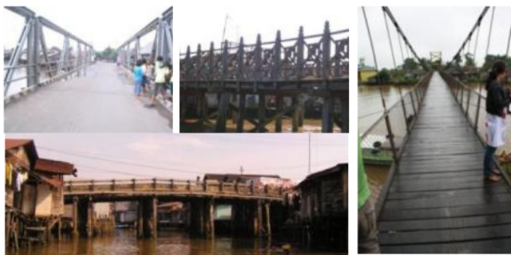
Gambar 1. Tipe-tipe Jembatan pada permukiman tepi sungai

Jembatan adalah struktur konstruksi yang berfungsi untuk menghubungkan dua bagian jalan yang terputus karena adanya rintangan alam yang tidak memungkinkan untuk dilewati seperti lembah yang dalam, alur sungai, saluran irigasi dan rintangan lainnya. Jembatan pada permukiman tepi sungai memiliki fungsi utama sebagai jalur penghubung antara jalan darat yang terpisahkan oleh jalur sungai. Sebagai salah satu aspek tipomorfoologi, jembatan pada permukiman tepi sungai ini memiliki beberapa karakter khas selain sebagai jalur penghubung. Karakter tersebut terlihat dari keragaman bentuk jembatan (sebagian besar berbahan kayu dan beberapa jembatan menggunakan detail pagar ciri khas ukiran Banjar). Karakter lainnya adanya ikatan yang kuat antara jembatan dengan aktifitas masyarakat seperti kebiasaan atraksi anak-anak yang terjun ke sungai dari atas jembatan yang tidak terlalu tinggi, terjadinya pasar tumpah di atas jembatan, atau aktifitas menikmati lalu lintas sungai dari atas jembatan.