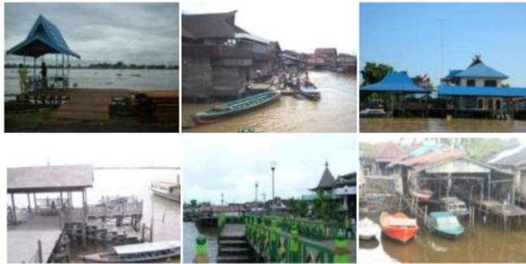
Gambar 2. Dermaga Panggung dan Dermaga Rakit (terapung)

Untuk dermaga yang berukuran kecil (5x5m – 6x6m) biasanya dibangun dengan konstruksi rakit (terapung). Kapal-kapal kecil yang datang bertambat langsung di bagian tepi dermaga. Pengantar dan penjemput bisa ikut turun ke dermaga tapi bisa juga menunggu di bagian darat dermaga. Untuk menuju dermaga rakit biasanya dihubungkan dengan titian kecil dari kayu yang bertumpu langsung ke balok kayu yang mengikat dermaga tersebut. Selain dua jenis dermaga ini terdapat juga dermaga-dermaga kecil yang menyatu dengan rumah-rumah penduduk. Pemilik rumah bisa langsung menambatkan kapal kecil (kelotok atau jukung) di belakang rumah mereka. Biasanya dermaga ini bersifat privat, dan bisa dianalogikan seperti tempat parkir/garasi pada rumah-rumah di darat.