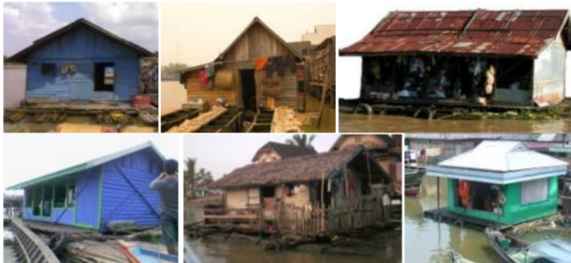
Gambar 4. Rumah-rumah lanting

Rumah lanting adalah salah satu rumah tradisional suku Banjar yang dibangun diatas air . Rumah-rumah lanting ini dapat dibedakan berdasarkan fungsinya, struktur pondasinya dan konstruksi materialnya. Ditinjau dari fungsinya rumah lanting tidak hanya berfungsi sebagai rumah tinggal, melainkan berfungsi juga sebagai rumah toko, atau toko/warung. Jika dilihat dari sejarahnya, sebenarnya sejak dulu rumah lanting sudah digunakan sebagai rumah toko, atau toko/warung saja. Hal ini bisa dipahami karena pada waktu itu transportasi air merupakan transportasi utama di Kota Banjarmasin. Pada saat ini masih bisa ditemui rumah-rumah lanting yang memiliki fungsi-fungsi tersebut.