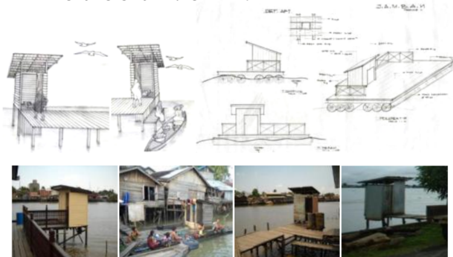
Gambar 8. Jamban umum dengan konstruksi panggung dan konstruksi rakit

Berdasarkan fungsinya, jamban umum ini dapat dibedakan menjadi 2, yaitu ; jamban yang hanya berfungsi untuk keperluan buang air saja, dan jamban umum yang berfungsi untuk MCK. Pada jamban yang hanya berfungsi untuk keperluan buang air saja biasanya tidak berhubungan langsung dengan air (biasa dengan konstruksi panggung), sedangkan jamban umum yang berfungsi untuk MCK biasanya dengan dimensi yang lebih besar karena tersedia juga tempat terbuka untuk mandi atau tempat berinteraksi dengan pedagang berperahu yang melewatinya.