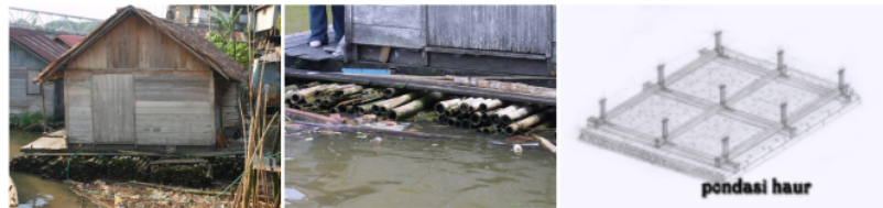
Gambar 6. Material pondasi dari bambu (haur)

Untuk itu, pondasi pada rumah lanting sangat mengandalkan pada kemampuan daya apung dari material pondasi. Sebagaimana diketahui, khususnya pada masa-masa lalu di daerah ini memiliki potensi kayu yang sangat melimpah. Sehingga dengan melihat atau belajar dari alam masyarakat setempat menggunakan bahan kayu (masih berbentuk gelondongan/log) sebagai pondasi rumah lanting ini. Seiring semakin bertambahnya kebutuhan manusia akan kayu, dan semakin sulitnya mendapatkan kayu, maka masyarakat secara alamiah bertahan terhadap kondisi ini. Dalam perkembangannya, masyarakat memilih bambu sebagai bahan pengganti kayu gelondongan tersebut. Dipilihnya bahan bambu masih didasarkan atas kemudahan mendapatkan bahan ini di lingkungan setempat.