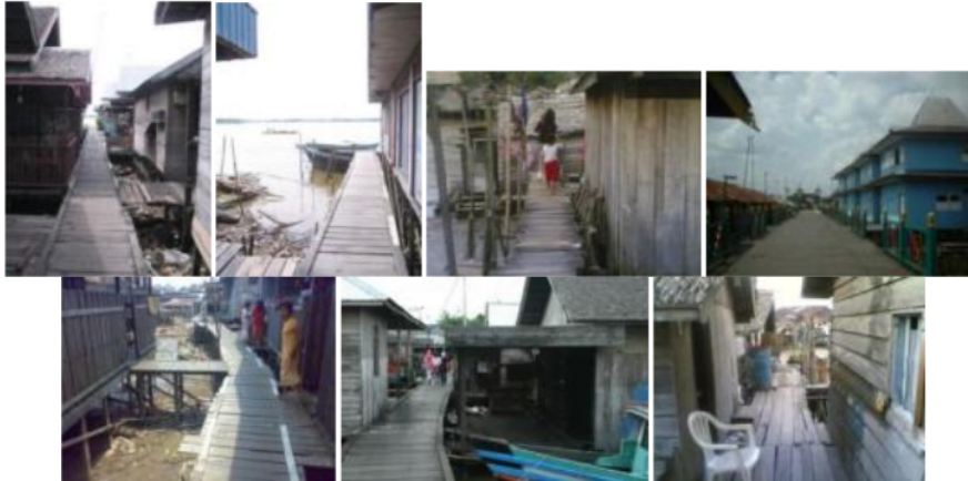
Gambar 3. Tipe-tipe Titian pada permukiman tepi sungai