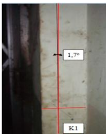
Gambar 5. Gambar kolom kode K1 yang mengalami kemiringan 1,7 derajat)