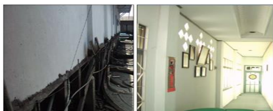
Gambar 10. Dinding bata bagian pinggir mengalami kemiringan, dan dinding bata pada tingkat-2 yang masih baik

Dinding terbuat dari plesteran bata hanya pada tingkat -1, sedangkan tingkat 2 dinding terbuat dari papan kayu. Hampir semua dinding bata mengalami retak yang > dari 5 mm (lihat Gambar 11).