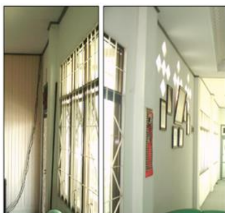
Gambar 6. Gambar kolom tingkat-2 yang masih baik