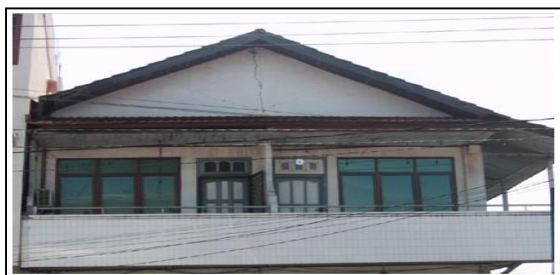
Gambar 9. Dinding bata dibawah atap mengalami keretakan

Struktur kuda-kuda terbuat dari kayu ulin dengan penutup atap terbuat dari genteng metal, terdapat retak pada dinding bagian depan dibawah atap-kuda-kuda dengan lebar retak > 1 cm.