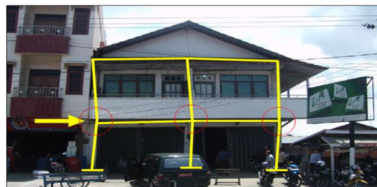
Gambar 12. Terjadi pergeseran horisontal pada tingkat 1 dan 2

Terjadi pergeseran horisontal pada lantai 1 sebesar 10 cm kekanan pada bagian kolom depan (K1 s.d. K12), sedangkan pada tingkat 2 hanya terjadi pergeseran yang kecil ke kiri (lihat Gambar 12).