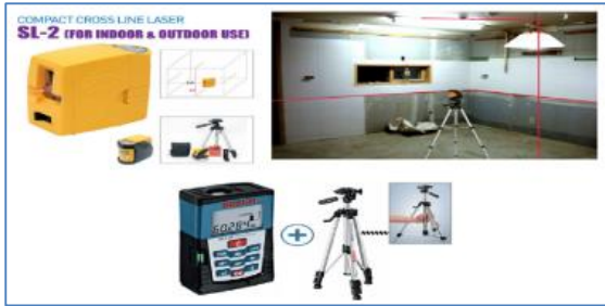
Gambar 2. Alat Auto Levelling SL-2 dan Laser Rangefinder Bosch DLE-70