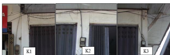
Gambar 4. Gambar kerusakan dan kemiringan kolom K1 K2, dan K3