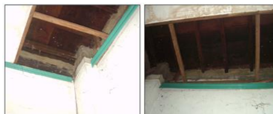
Gambar 7. Balok kayu ulin pada lantai 1 tidak mengalami kerusakan

Balok memanjang dan melintang pada lantai 1 terbuat dari kayu ulin dengan ukuran 6 x 12 cm. Dari pengamatan visual pada bagian balok dibagian depan rumah Bapak Heriyanto kondisinya tidak mengalami kerusakan, sedangkan kondisi balok yang lain tidak dapat terlihat karena didalam plafond (lihat Gambar 7).