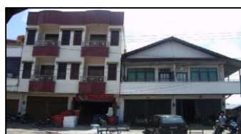
Gambar 1. Dari kiri Bangunan Rumah Tinggal Bapak Heriyanto dan Bapak Gunadi

Bangunan Rumah Tinggal bertingkat 2 yang sekarang didiami oleh Bapak Gunadi dan Bapak Heriyanto dibangun pada tahun 1995 berukuran 8 x 30 m, bangunan tersebut struktur utamanya terbuat dari Kayu Ulin dengan ukuran 17x17 cm dan balok 6x12 cm dengan lantai dasar dilapisi keramik 30x30 dan lantai 1 yang terbuat dari papan kayu ulin, dan dinding terbuat dari bata 2 tingkat, serta struktur atap terbuat dari kayu ulin dan penutup atap dari genteng metal. Kemudian kolom dilapisi dengan beton bertulangan utama dan geser sehingga menjadi berukuran 40x40 cm (lihat Gambar 1). Pada tahun 2007 orang ke-3 Toko Harapan Jaya yang bersebelahan dengan rumah Bapak Heriyanto membangun ruko yang terbuat dari struktur beton bertulang tingkat 3 dengan ukuran bangunan 8 x 30 m. Setelah itu pada awal tahun 2009 bangunan rumah Bapak Gunadi Utomo dan Bapak Heriyanto mengalami retak-retak dan mengalami kemiringan dan penurunan bangunan. Sehubungan dengan permasalahan tersebut diatas, maka perlu dilakukan pemeriksaan dan pengkajian terhadap bangunan tersebut, agar dapat disimpulkan seberapa jauh pengaruh kemiringan dan penurunan terhadap kondisi bangunan.