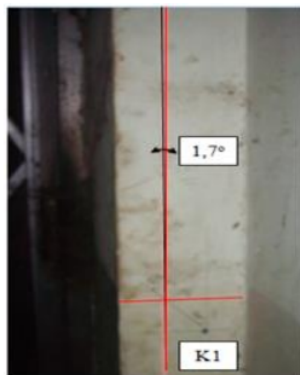
Gambar 5. Gambar kolom kode K1 yang mengalami kemiringan 1,7 derajat)