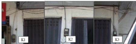
Gambar 4. Gambar kerusakan dan kemiringan kolom K1 K2, dan K3