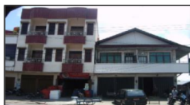
Gambar 1. Dari kiri Bangunan Rumah Tinggal Bapak Heriyanto dan Bapak Gunadi

Bangunan Rumah Tinggal bertingkat 2 yang sekarang didiami oleh Bapak Gunadi dan Bapak Heriyanto dibangun pada tahun 1995 berukuran 8 x 30 cm, bangunan tersebut struktur utamanya terbuat dari Kayu Ulin dengan ukuran 17x17 cm dan balok 6x12 cm dengan lantai dasar dilapisi keramik 30x30 dan lantai 1 yang terbuat dari papan kayu ulin, dan dinding terbuat dari bata 2 tingkat, serta struktur atap terbuat dari kayu ulin dan penutup atap dari genteng metal. Kemudian kolom dilapisi dengan beton bertulangan utama dan geser sehingga menjadi berukuran 40x40 cm (lihat Gambar 1). Pada tahun 2007 orang ke-3 Toko Harapan Jaya yang yang bersebelahan dengan rumah Bapak Heriyanto membangun ruko yang terbuat dari struktur beton bertulang tingkat 3 dengan ukuran bangunan 8 x 30 m. Setelah itu pada awal tahun 2009 bangunan rumah Bapak Gunadi Utomo dan Bapak Heriyanto mengalami retak-retak dan mengalami kemiringan dan penurunan bangunan. Sehubungan dengan permasalahan tersebut diatas, maka perlu dilakukan pemeriksaan dan pengkajian terhadap bangunan tersebut, agar dapat disimpulkan seberapa jauh pengaruh kemiringan dan penurunan terhadap kondisi bangunan.