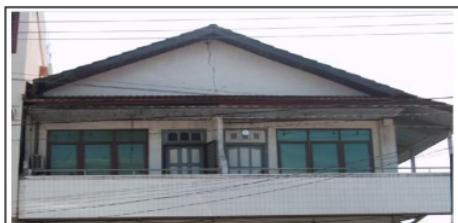
Gambar 9. Dinding bata dibawah atap mengalami keretakan

Struktur kuda-kuda terbuat dari kayu ulin dengan penutup atap terbuat dari genteng metal, terdapat retak pada dinding bagian depan dibawah atap-kuda-kuda dengan lebar retak > 1 cm.