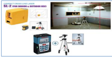
Gambar 2. Alat Auto Levelling SL-2 dan Laser Rangefinder Bosch DLE-70