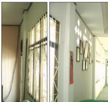
Gambar 6. Gambar kolom tingkat-2 yang masih baik