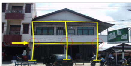
Gambar 12. Terjadi pergeseran horisontal pada tingkat 1 dan 2

Terjadi pergeseran horisontal pada lantai 1 sebesar 10 cm kekanan pada bagian kolom depan (K1 s.d. K12), sedangkan pada tingkat 2 hanya terjadi pergeseran yang kecil ke kiri (lihat Gambar 12).