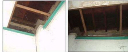
Gambar 7. Balok kayu ulin pada lantai 1 tidak mengalami kerusakan

Balok memanjang dan melintang pada lantai 1 terbuat dari kayu ulin dengan ukuran 6 x 12 cm. Dari pengamatan visual pada bagian balok dibagian depan rumah Bapak Heriyanto kondisinya tidak mengalami kerusakan, sedangkan kondisi balok yang lain tidak dapat terlihat karena didalam plafond (lihat Gambar 7).