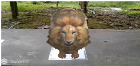
Gambar 3. Desain Tampilan Halaman AR Simulasi

Pada halaman AR Simulasi nantinya akan mengakses kamera yang akan digunakan untuk melihat objek 3D hewan karnivora, herbivora dan omnivora secara utuh dengan cara mengarahkan kamera handphone android tersebut ke kertas marker yang sudah disediakan.