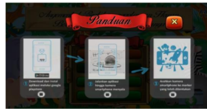
Gambar 5. Desain Tampilan Halaman Panduan

Tampilan halaman tentang merupakan halaman yang menampilkan tentang profil pengembang.