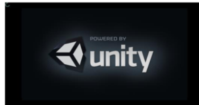
Gambar 1. Desain Tampilan Halaman Splash Screen

Tampilan halaman splash screen ini adalah tampilan awal pada saat aplikasi dijalankan yang menampilkan gambar atau nama aplikasi.