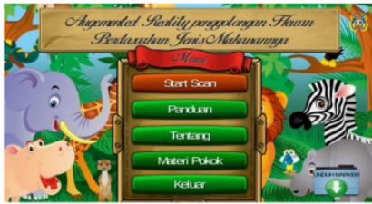
Gambar 2. Desain Tampilan Halaman Menu Utama