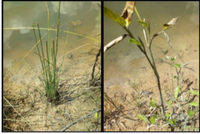
Gambar 4. Tanaman purun tikus dan bamban di tepian void

Tanaman air lain yang ditanam di tanah yang berbatasan dan terendam perairan void adalah purun tikus ( Eleocharis dulcis ) dan tanaman bamban ( Donax camiformis ). Persentase tumbuh kedua tanaman ini di atas 95%. Kenampakan penotifik kedua tanaman ini dilingkungan void terdeskripsi pada Gambar 4.