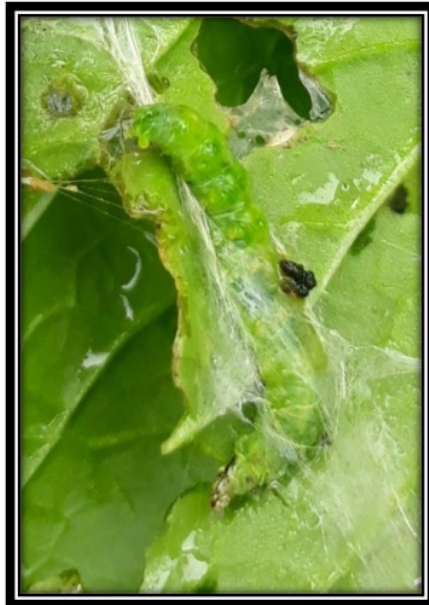
Gambar 3. Ulat Jengkal ( C.chalcites ) yang Menyerang Tanaman Daun sawi