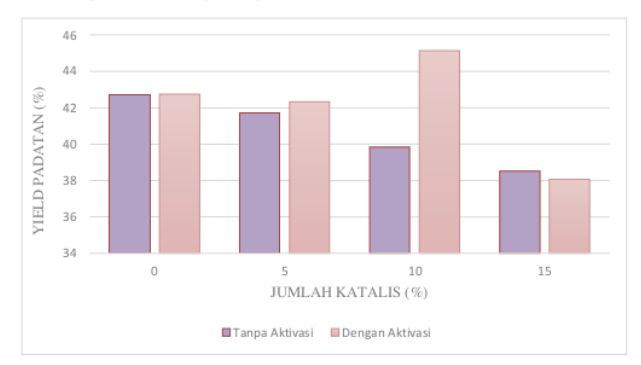
Gambar 2. Pengaruh Jumlah dan Aktivasi Katalis terhadap Yield Padatan

padatan juga mengalami perubahan seiring peningkatan jumlah katalis dan aktivasi katalis. Pengaruh jumlah dan aktivasi katalis terhadap yield produk padatan ditunjukkan pada Gambar 2.