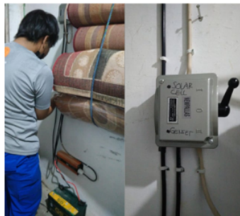
Gambar 1.4. Pemasangan instalasi panel surya di Mushola Nurul Hikmah

Setelah penginstaliran alat dan pelengkap instalasi tenaga surya telah dilakukan langkah selanjutnya adalah memastikan apakah instalasi tenaga surya yang kita pasang bekerja sesuai rancangan, gambar 1.6. adalah gambar uji coba pengoperasian sel surya di mushola nurul hikmah.