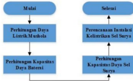
Gambar 1.1. Perencanaan Teknologi Sel Surya

Perencanaan teknologi sel surya terdiri dari beberapa tahapan yang perlu untuk dilakukan. Adapun dari perencanaan ini ditunjukkan pada gambar 1.1.