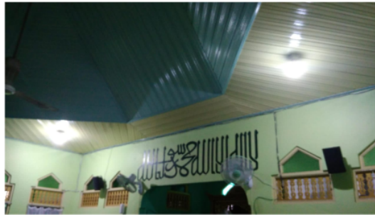
Gambar 1.6. Uji coba penyalaaan lampu hasil instalasi panel surya di Mushola Nurul Hikmah