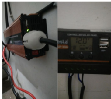
Gambar 1.5. Pemasangan instalasi panel surya di Mushola Nurul Hikmah