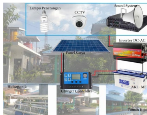
Gambar 1.3. Skema Teknologi Energi Terbarukan berbasis Sel Surya

Target yang ingin dicapai dalam Program Kemitraan Masyarakat (PKM) berupa peningkatan efisiensi daya listrik terpakai yang memanfaatkan sumber energi terbarukan dari sel surya sebagai sumber energi listrik utama, pemahaman dan transfer keterampilan instalasi dan perawatan teknologi sel surya. Adapun luaran dari pengabdian masyarakat ini adalah Instalasi jaringan listrik berbasis sel surya yang dapat menjadi sumber listrik utama untuk penerangan, kipas angin, power supply CCTV, Sound System, dan Pompa Hidroponik Sementara sumber energi listrik cadangan berasal dari PLN dan Genset di Mushola Nurul Hikmah. Teknologi ini diharapkan dapat membantu mengatasi permasalahan di Mushola Nurul Hikmah. Alat ini terdiri dari Sel Surya, Solar Charger Controller, Inverter, MCB, dan Aki Maintenance Free. Seperti yang ditunjukkan pada Gambar 1.3.