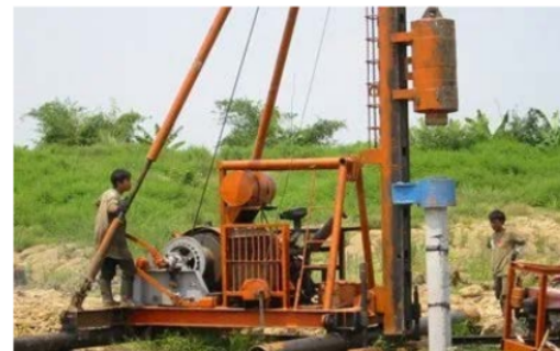
Gambar 2. Pile Driver Drop Hammer

Fungsi, kapasitas, cara pengoperasian alat, dan metode pelaksanaan, ekonomi, jenis proyek, lokasi proyek, jenis dan daya dukung tanah, serta kondisi lapangan, merupakan faktor-faktor yang menentukan pemilihan alat berat untuk pekerjaan tertentu. Penentuan tipe dan banyaknya alat berat yang akan digunakan memerlukan perencanaan yang tepat, disesuaikan dengan apa yang akan digunakan, seberapa besar volume pekerjaan serta kondisi medan kerja (Fitrianti, Nur Latifah D., 2014).