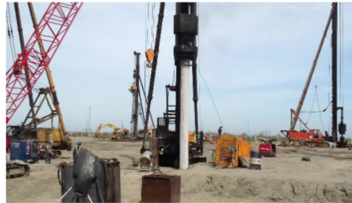
Gambar 1. Alat Pancang Diesel Hammer

Alat untuk memasang tiang kedalam tanah sampai mencapai kedalaman tertentu menggunakan alat pemancangan yang biasanya disebut dengan Pile Driver (alat pancang). Drop Hammer, Pile Driver Diesel Hammer, Hydraulic Pile Hammer, Single Acting Steam or Air Hammer, Vibratory Pile Driver merupakan beberapa jenis alat pancang. (Gambar 1 dan 2).