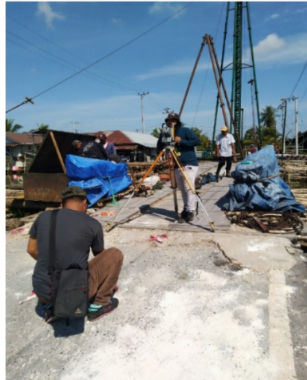
Gambar 3. Penentuan Titik Tiang Pancang

Titik-titik tiang pancang ditentukan menggunakan alat total station. Pengukuran pertama ditentukan dari satu titik acuan yaitu BM (Bench Mark) untuk ke titik-titik pengukuran selanjutnya (Gambar 3).