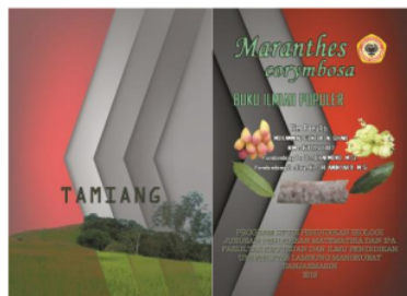
Gambar 1 Cover Depan dan Belakang BIP Etnobotani Tumbuhan Maranthes corymbosa