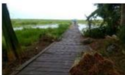
Jalan Usaha Tani Ulin