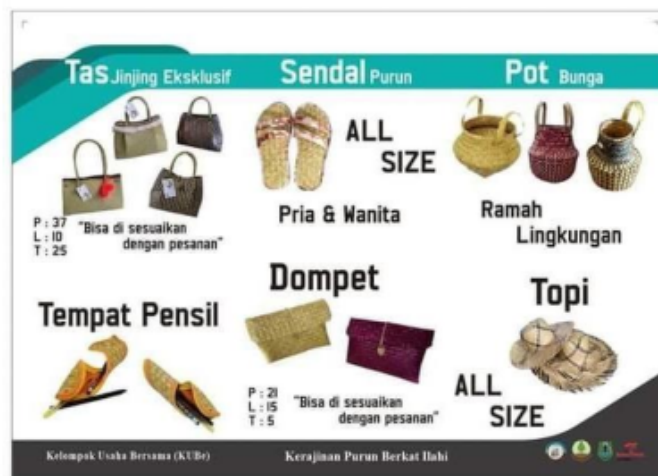
Gambar 3.2 Ragam Kerajinan Purun

Pengrajin purun sebagai pelaku usaha di Desa Pulantani berperan dalam melestarikan kearifan lokal. Selaras dengan budaya dan tradisi menganyam purun yang telah ada kurang lebih sejak 500 tahun yang lalu, kemudian diwariskan oleh generasi kaum perempuan dimasa lampau ke generasi kaum perempuan saat ini (Yuliani,2020). Selain itu, pemanfaatan pengolahan tumbuhan purun juga mempertahankan kondisi desa agar ekosistem tetap terjaga. Hal ini sejalan dengan bentuk pedesaan berupa wilayah rawa maka