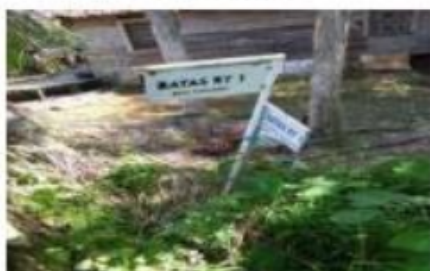
Batas RT 01