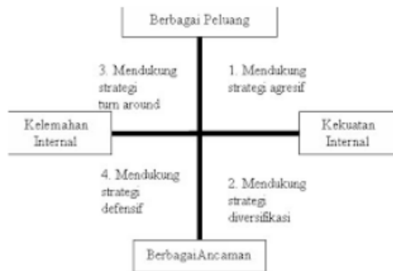
Gambar 2.2 Diagram Analisis SWOT

Menurut Freddy Rangkuti dalam Analisis SWOT: Teknik Membedah Kasus Bisnis (2014, p20-21), Analisis SWOT membandingkan antara factor eksternal peluang ( Opportunities ) dan ancaman ( Threats ) dengan factor internal kekuatan ( Strength ), dan kelemahan ( Weaknesses ).