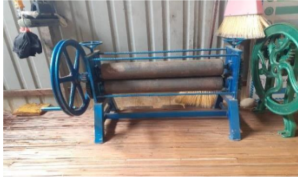
Gambar 3.3 Alat pemipih purun

Keterbatasan yang dirasakan para pengrajin purun desa Pulantani berimbas pada proses pengerjaan kerajinan purun baik dari segi waktu dan tenaga. Pengerjaan yang kurang optimal maka akan mempengaruhi tingkat pemesanan oleh konsumen dan daya beli wisatawan.