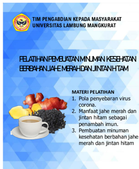
Gambar 3. Flyer yang disebarakan lewat whatsapp anggota pengajian

Setelah identifikasi dan solusi yang ditawarkan, selanjutnya memberikan pengumuman melalui flyer yang disebarakan malalui media whatsapp (gambar 3). Pemberian materi ini dilaksanakan secara tatap muka.