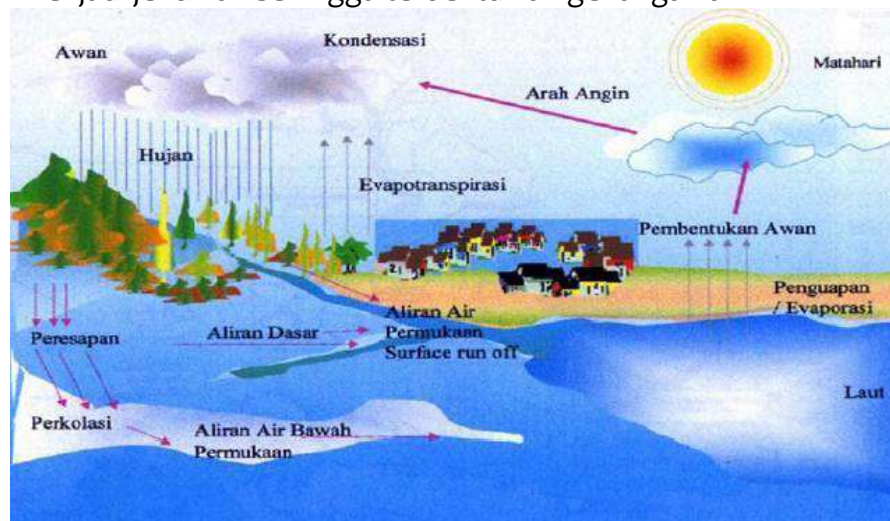
Gambar 4.1 Siklus Hidrologi

Siklus air (siklus hidrologi) adalah rangkaian peristiwa yang terjadi dengan air dari saat air jatuh ke bumi (hujan) hingga menguap ke udara untuk kemudian jatuh kembali ke bumi yang merupakan konsep dasar keseimbangan air secara global dan menunjukkan semua hal yang berhubungan dengan air. Prosesnya sendiri berlangsung mulai dari tahap awal terjadinya proses penguapan ( evaporasi ) secara vertikal dan di udara mengalami pengembunan ( evapotranspirasi ), lalu terjadi hujan akibat berat air atau salju yang ada di gumpalan awan. Kemudian, air hujan jatuh keatas permukaan tanah yang mengalir melalui akar tanaman dan ada yang langsung masuk ke pori-pori tanah. Didalam tanah terbentuklah jaringan air tanah ( run off ) yang juga mengalami transpirasi dengan butir tanah. Sehingga dengan air yang berlebih tanah menjadi jenuh air sehingga terbentuklah genangan air.