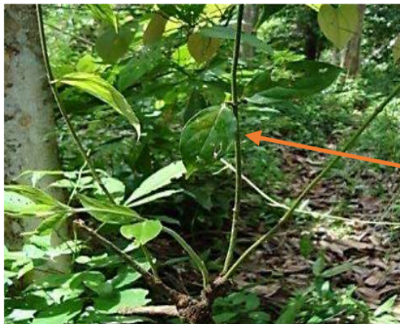
Gambr 1. Tumbuhan C. Tomentosa

Pemisahan kandungan kimia dan aktivitasnya sebagai Heme Polymerization Inhibitory Activity (HPIA) terhadap fraksi etil asetat batang C. Tomentosa perlu dilakukan. Hal ini dimaksudkan sebagai eksplorasi dan penelusuran golongan senyawa yang beraktivitas sebagai penghambatan polimerisasi hem. Pemisahan dilakukan dengan fraksinasi dengan menggunakan pelarut n -heksan, etil asetat, dan n -butanol atau dengan pelarut lainnya (Arnida 2015).