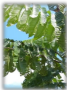
Gambar 1. Sampel daun tanaman mataoa ( Pometia pinnata )

Berdasarkan uraian di atas, maka perlu dilakukan proses standardisasi untuk tanaman P. pinnata dengan tujuan yaitu menstandarisasi simplisia dan ekstrak dari daun P. pinnata . Penelitian ini diharapkan memberi sebuah informasi tentang standardisasi simplisia dan ekstrak daun P. pinnata yang berguna untuk penelitian selanjutnya. Daun tanaman P. pinnata disajikan pada Gambar 1.