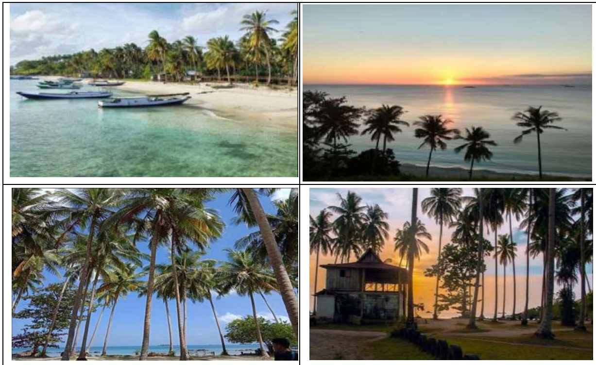
Gambar 1 Lokasi wisata di Tanjung Selayar Figure 1 Tourist sites in Tanjung Selayar

Objek wisata Nusa Dua di Desa Tanjung Tengah menawarkan pemandangan lain yaitu batu-batu besar serta terdapat banyak mangrove dan yang paling utama obyek wisata ini merupakan ujung dari Kotabaru yang di kelilingi oleh beberapa gunung dari desa sekitarnya yaitu Tanjung Kunyit dan Teluk Tamiang yang juga merupakan objek wisata juga dan sering diadakan acara adat memberi makan laut atau mappanre tasi . Lokasi objek wisata Nusa Dua ini berada di ketinggian bukit sehingga banyak pengunjung yang terkadang berkemah dan memancing ikan bakau dan ikan karang yang masih cukup banyak dan terjaga kelestariannya seperti ikan kakap, kerapu, dan ikan pantai lainnya