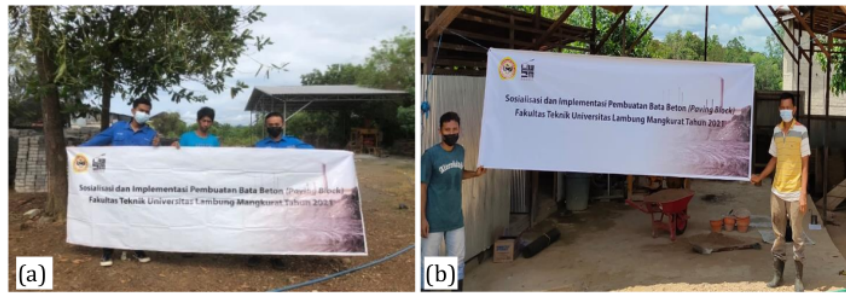
Gambar 2. Sosialisasi dalam bentuk leaflet dan kunjungan ke lokasi mitra pada kegiatan pengabdian kepada masyarakat