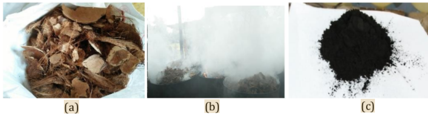
Gambar 4. Proses pengolahan limbah menjadi abu tempurung kelapa

Pertama-tama, limbah tempurung kelapa diolah terlebih dahulu dengan 6 ara metode pembakaran agar mendapatkan abu tempurung kelapa, seperti yang ditunjukkan pada Gambar 4 .