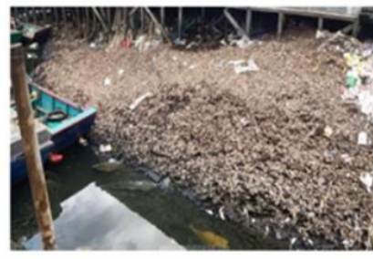
Gambar 1. Limbah tempurung kelapa di pemukiman penduduk (suarakalimantan.com)