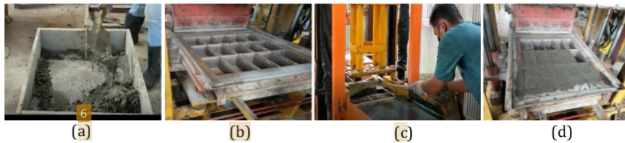
Gambar 6. Proses demo pembuatan dan pressing eco paving block abu tempurung kelapa