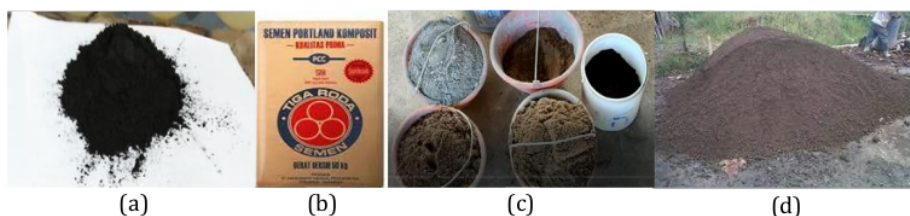
Gambar 5. Material penyusun eco paving block abu tempurung kelapa

Pembuatan eco paving block dimulai dengan menyiapkan material utama seperti pasir. Pasir harus disaring menggunakan 2 saringan no. 4 dengan bukaan 4,75mm. Kemudian dicampur dengan material perekat yaitu semen, abu tempurung kelapa dan air. Selanjutnya campuran material diaduk sampai pada kekentalan yang diinginkan lalu dicetak campuran eco paving block pada mesin pencetak dengan menggunakan sekop. eco paving block dibuat secara mekanis dalam proses pemadatan dan pencetakannya. Perawatan dapat dilakukan dengan perendaman dengan air dan ditutup plastik hitam kedap air. Implementasi pembuatan eco paving block seperti terlihat di Gambar 5 sampai Gambar 7.