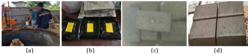
Gambar 7. Demo perawatan ( curing ) eco paving block abu tempurung kelapa