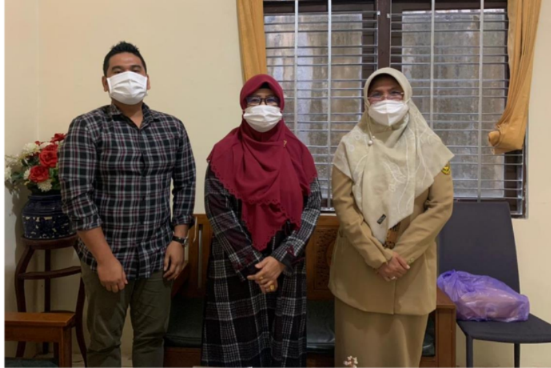
Penelitian di Dinas Koperasi UKM dan Naker Banjarmasin