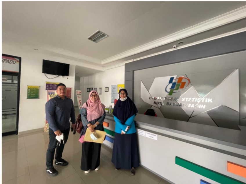
Penelitian di BPS