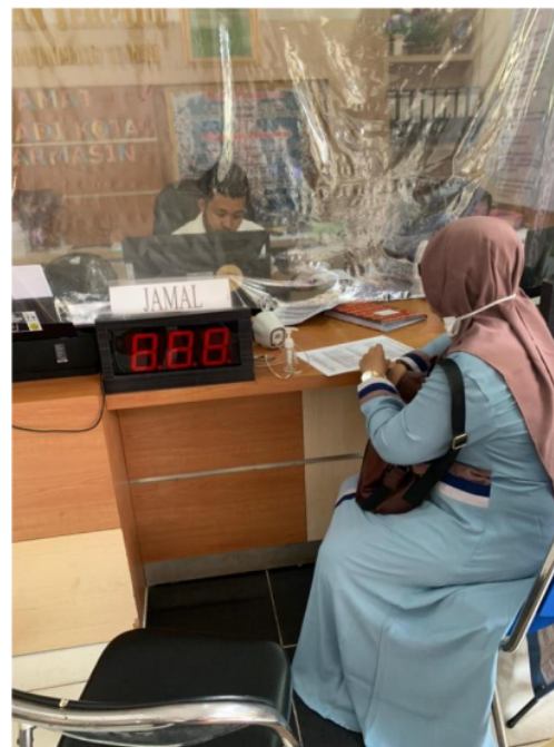
Penelitian di kantor kecamatan kota Banjarmasin Tengah