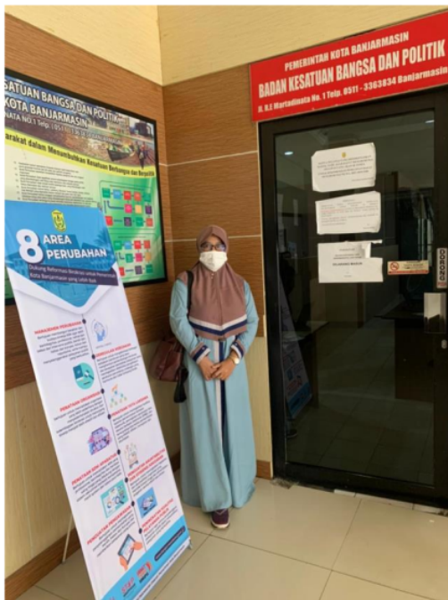
Penelitian di Usaha Mikro Rumah Kreatif Pintar