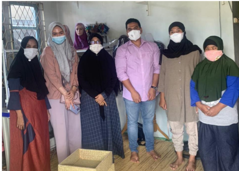
Penelitian di Usaha Mikro Rumah Kreatif Pintar