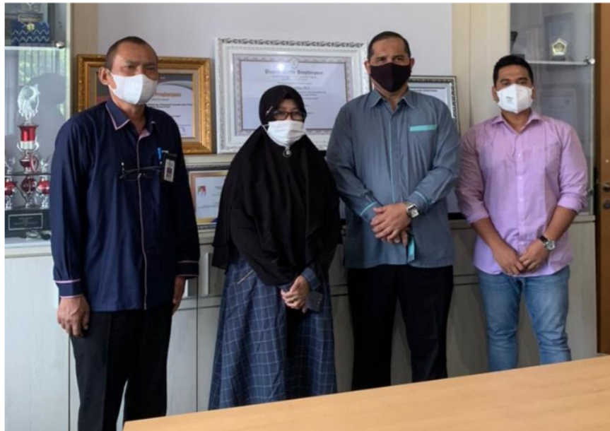
Penelitian di BP2T