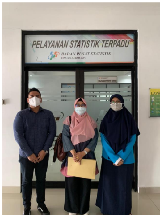
Penelitian di BPS