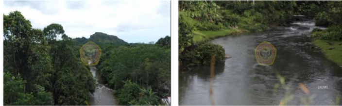
Gambar 2. Sungai yang ada di lereng Gunung Liang

tersebut. Biasanya pengunjung mandi di sungai tersebut menghilangkan penat sehabis perjalanan jauh menuju lokasi obyek wisata Gunung Liang ini, maupun sehabis melakukan pendakian. Sungai yang ada di lereng obyek wisata Gunung Liang ini merupakan sungai yang dijaga oleh masyarakat Desa Riam Adungan, dikarenakan untuk menjaga keaslian dan menghindari adanya pencemaran di sungai tersebut.