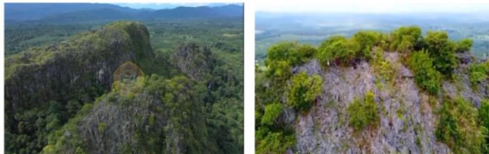
Gambar 1. Panorama Gunung Liang

Potensi Gunung Liang ini adalah gunung batuan kapur memiliki yang panorama sangat indah dan alami, kondisi alam masih hijau yang berdekatan dengan pegunungan meratus. Gunung Liang ini merupakan aset yang sangat berharga bagi masyarakat Desa Riam Adungan yang sangat dijaga dan dilindungi masyarakat setempat, obyek wisata Gunung Liang ini memiliki kekurangan seperti rute atau petunjuk yang belum jelas menuju puncak Gunung Liang.