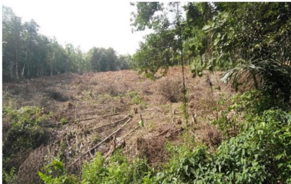
Gambar 4. Lahan setelah ditebas

Seringkali masyarakat juga melakukan penebangan pohon yang cukup besar yang tumbuh di lahan mereka, apabila pohon tersebut cukup besar mereka menggunakan chain saw . Kayu dari pohon tersebut dimanfaatkan untuk keperluan rumah tangga sebagai kayu bakar. Berdasarkan wawancara terhadap responden proses pembukaan dan pembersihan lahan kembali ini selesai dalam waktu kurang lebih 7 (tujuh) hari. Biasanya memerlukan waktu sekitar 15 (lima belas) hari atau lebih sampai dirasa cukup kering agar mudah terbakar saat kegiatan pembakaran ( manyalukut ) dilakukan. Proses pembukaan dan pembersihan lahan biasanya dilakukan oleh masyarakat adat Desa Balawaian pada awal bulan Juni. Lahan yang telah ditebas bisa dilihat pada gambar 4.