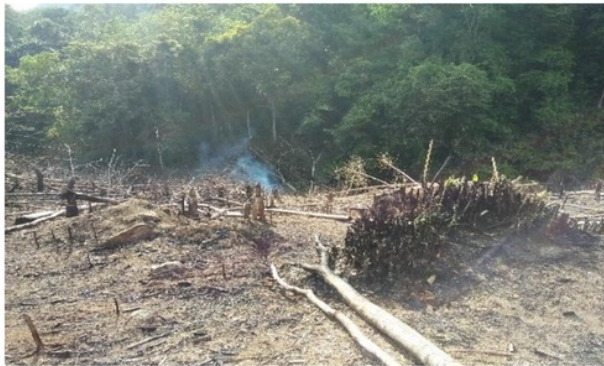
Gambar 6. Lahan setelah dibakar

Menurut informasi dari responden, proses pemadaman api dengan cara dijaga dan dipukul-pukul merupakan upaya pengendalian agar api tidak menjalar ke arah yang tidak diinginkan. Pembakaran biasanya dilakukan tidak lebih dari 2 (dua) jam dan dilakukan pada siang hari berkisar antara pukul 11.00 sampai dengan 15.00 WITA. Menurut responden penentuan waktu membakar ini telah menjadi tradisi turun temurun dan mereka meyakini bahwa pada jam tersebut material sudah benar-benar kering sehingga mudah terbakar, menurut mereka apabila dilakukan diluar waktu tersebut maka material tidak mudah terbakar karena dianggap masih terdapat embun sisa malam hari. Hal ini sesuai menurut Rohasan (1998) dikutip oleh Sukarno (2017), yang menyebutkan waktu membakar dipilih pada saat hari betul-betul panas dan biasanya pada tengah hari antara pukul 11.30 – 12.30 WIB. Lahan akan ditinggalkan apabila api telah dianggap benar-benar padam dan aman. Lahan yang setelah manyalukut dapat dilihat pada gambar 6.