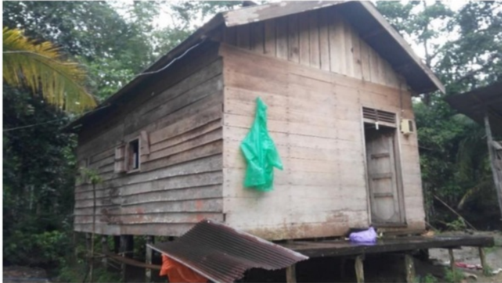
Gambar 1. Salah satu rumah masyarakat adat Desa Balawaian

Pengamatan di lapangan menunjukkan bahwa masyarakat adat Desa Balawaian memiliki 2 balai adat, dimana (1) satu balai adat tidak ditempati oleh masyarakat karena mereka sudah memiliki tempat tinggal masing-masing dan (satu) balai adat dipergunakan saat masyarakat melakukan kegiatan pertemuan warga dan kegiatan adat termasuk ritual adat syukuran ( aruh ) yang merupakan bagian dalam kegiatan berladang. Balai adat yang terdapat di Desa Balawaian dapat dilihat pada gambar 2.