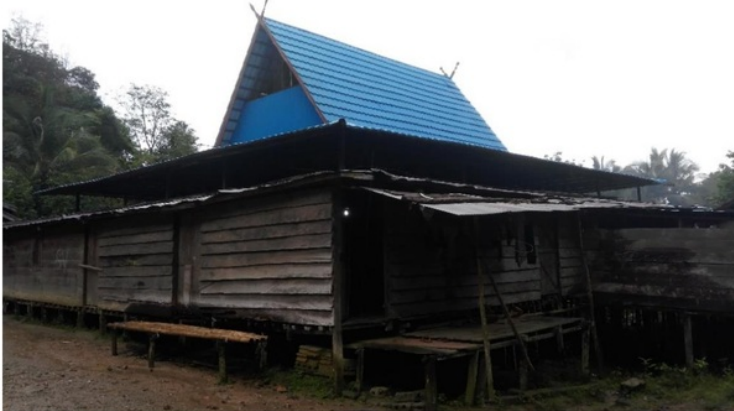
Gambar 2. Balai adat

Pengamatan di lapangan menunjukkan bahwa masyarakat adat Desa Balawaian memiliki 2 balai adat, dimana (1) satu balai adat tidak ditempati oleh masyarakat karena mereka sudah memiliki tempat tinggal masing-masing dan (satu) balai adat dipergunakan saat masyarakat melakukan kegiatan pertemuan warga dan kegiatan adat termasuk ritual adat syukuran ( aruh ) yang merupakan bagian dalam kegiatan berladang. Balai adat yang terdapat di Desa Balawaian dapat dilihat pada gambar 2.