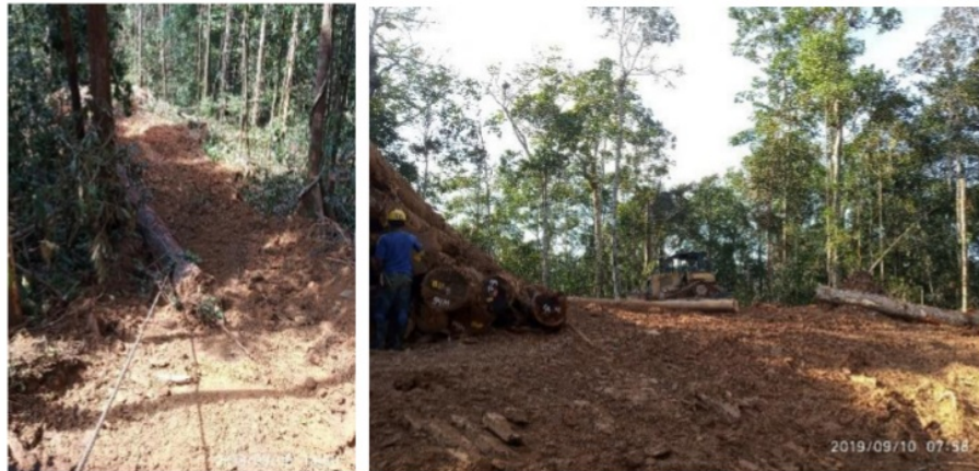
Gambar 4. Kegiatan Penyaradan

hal yang perlu diperhatikan dalam penyaradan kayu meliputi: mengangkat pisau traktor setinggi \pm 0.5 m selama kegiatan penyaradan berlangsung; Tidak melakukan penyaradan ketika sedang hujan atau ketika tanah masih sangat basah; Menghindari skidder winch keluar dari jalan sarad (Manuver); Menghindari pengupasan tanah akibat pisau traktor pada kelerengan < 25\% serta melukai pohon pada kiri-kanan jalan sarad; Menggunakan wire rope untuk menarik kayu balak dari tunggul; Menghindari masuknya skidder winch ke dalam kawasan lindung; Tidak melakukan manuver pada areal sempadan sungai dan alur. Penyaradan kayu balak pada sempadan alur (5 m kiri-kanan alur) harus dilakukan dengan menggunakan wirerope agar tidak ada jejak skidder winch pada alur; dan menggunakan penyaradan dengan sistem langsir pada belokan tajam.