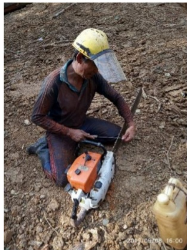
Gambar 3. Persiapan Alat sebelum Kegiatan Penebangan

Menurut Azwadri (2016) keterampilan dari operator dan helpernya dalam merawat dan memelihara chainsaw turut memengaruhi produktivitas dikarenakan kerusakan chainsaw dapat menyebabkan penurunan produktivitas. Namun pada penelitian yang dilaksanakan oleh peneliti menunjukkan bahwa operator chainsaw beserta helpernya telah merawat dan memelihara chainsaw dengan cukup baik yang ditunjukkan oleh rendahnya terjadinya kerusakan chainsaw di lapangan.