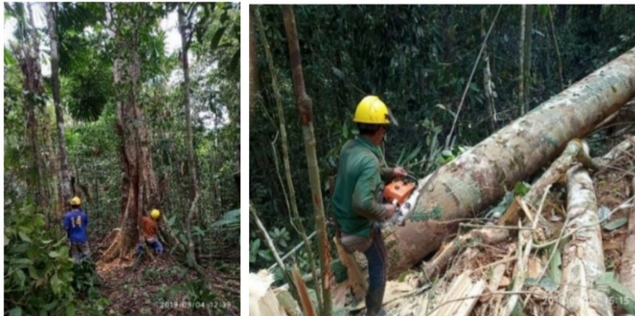
Gambar 2. Kegiatan Penebangan