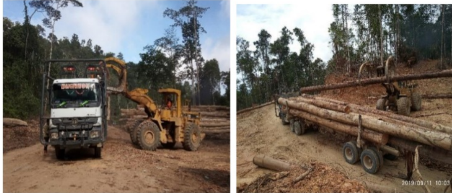
Gambar 5. Kegiatan Pemuatan dan Pembongkaran

Waktu efektif kegiatan pemuatan dan pembongkaran meliputi menurunkan crane dan memuat kayu untuk kegiatan pemuatan, sedangkan kegiatan pembongkaran meliputi pembongkaran kayu dan menaikkan crane .