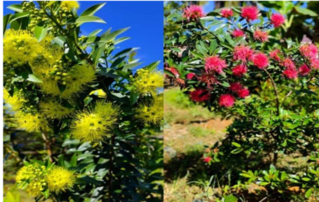
Gambar 1. Bunga Santos Kuning dan Merah untuk Pakan Lebah

Biaya variabel ialah biaya yang dapat berubah ketika aktivitas produksi meningkat atau menurun. Biaya variabel yang ada pada madu kelulut Zahra ini terdiri dari biaya upah pemanenan dan perawatan, biaya produksi dan pemasaran. Hasil perhitungan biaya variabel dapat dilihat dari Tabel 2 berikut.