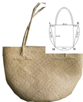
Gambar 1. Foto & Sketsa Anyaman Tas Rotan

Dua jenis kerajinan yang dihasilkan oleh Kelompok Lestari, yaitu tas dan keranjang. Rotan yang digunakan adalah rotan irit. Produk kerajinan anyaman tas rotan hasil dari produksi Kelompok Lestari dapat dilihat pada Gambar 1.