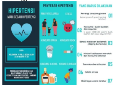
Gambar 3. Media penyuluhan berupa leaflet

Media lainnya yaitu booklet , merupakan berbentuk buku kecil. Ciri dari booklet yaitu buku berukuran kecil dan tipis, berisi informasi yang dilengkapi dengan gambar, dilengkapi penjelasan yang ringkas dan sistematis, berisi informasi pokok tentang hal yang dipelajari sehingga mudah dipahami, ekonomis dalam arti waktu dalam memperoleh informasi, seseorang mendapat informasi dengan caranya sendiri (Prasanti dan Ikhsan, 2018). Penelitian oleh Wijayanti dan Mulyadi (2018) menunjukkan bahwa ada pengaruh pendidikan kesehatan menggunakan booklet terhadap pemahaman pasien hipertensi di Puskesmas Kecamatan Pasar Minggu Tahun 2016.