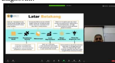
Gambar 3 Pemaparan Materi Miskonsepsi

ketidakoptimalan pencapaian tujuan pembelajaran di kelas bisa hadir karena pengajar belum sepenuhnya maksimal dalam melayani dan menyajikan pembelajaran. Hal ini senada dengan riset (Ryan & Herrington, 2014) bahwa level submikroskopik termasuk sulit untuk diimplementasi karena level ini memerlukan kemampuan visual dan daya nalar yang tinggi agar peserta didik bisa menginterpretasi materi yang diajarkan bahkan buat pengajar terkait level ini. perbedaan perspektif antara guru dan peserta didik di kelas bisa menjadi pemicu hadirnya miskonsepsi sehingga perlu menganalisa dan mengidentifikasi secara jauh hal-hal yang mampu meningkatkan miskonsepsi termasuk pengajar perlu membuat tes diagnostik.