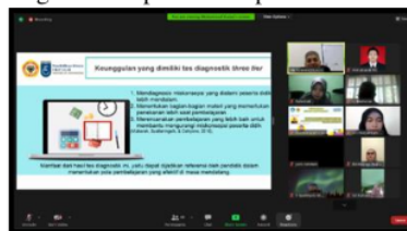
Gambar 4 Pemaparan Terkait Tes Diagnostik

Sehubungan dengan miskonsepsi, Hasil penelitian Utami et al. (2017) menunjukkan model pembelajaran CCT dapat direkomendasikan sebagai alternatif untuk meningkatkan kualitas pembelajaran kimia, memperbaiki model mental peserta didik, dan mereduksi miskonsepsi. Berikut dokumentasi pemaparan terkait tes diagnostic dapat dilihat pada Gambar 4.