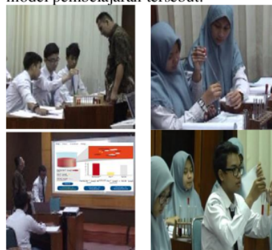
Gambar 4 Contoh video pembelajaran yang berorientasi metakognisi saat sosialisasi

oleh Tim pelaksana pengabdian kepada para peserta secara berkelompok. Pembimbingan yang dilakukan merupakan penjabaran dari langkah-langkah pembelajaran pada setiap sintaks model pembelajaran tersebut.