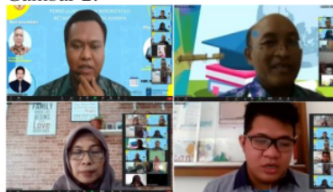
Gambar 2 Tanya Jawab Peserta

Setelah penyajian materi dilanjutkan diskusi dan tanya jawab dengan peserta terkait model pembelajaran berorientasi keterampilan metakognitif. Banyak pertanyaan dari peserta yang bertanya tentang langkah-langkah implementasi model i-SMART, GIAMQ, SRL serta tips dan trik strategi yang bisa digunakan dalam mengajar agar indikator pembelajaran dapat tercapai. Berikut dokumentasi sesi tanya jawab peserta dengan tim PkM dapat dilihat pada Gambar 2.