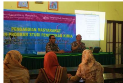
Gambar 2 Narasumber memberikan materi kepada peserta

kelola laboratorium serta keselamatan kerja di laboratorium. Berikut dokumentasi penyampaian materi oleh narasumber dapat dilihat pada Gambar 2.