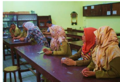
Gambar 4 Peserta menyimak pemaparan dari pemateri

bahwa kegiatan ini diminati dan memiliki dampak bagi peserta. Peserta menyadari bahwa dengan mengikuti kegiatan ini, mereka akan mendapatkan manfaat yang lebih dan sebagai sarana untuk mendapatkan pengetahuan baru dalam mengelola laboratorium IPA di sekolah. Berikut dokumentasi peserta pengabdian dapat dilihat pada Gambar 4.