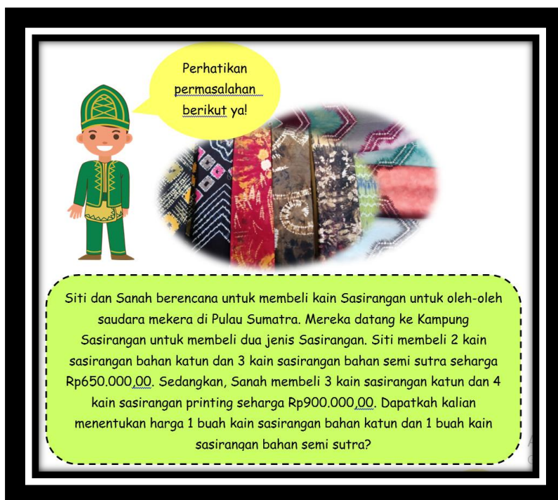
Gambar 2. Contoh Soal SPLDV Konteks Budaya Banjar Tipe Uraian

Berikut ini beberapa soal-soal SPLDV yang dikonstruksi dalam modul sehingga siswa dapat mengenal Budaya Banjar sebagai budaya di lingkungan sekitarnya yang dapat dilihat pada Gambar 2.