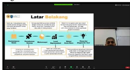
Gambar 3 Pemaparan Materi Miskonsepsi

ketidakefektifan pencapaian tujuan pembelajaran di kelas bisa hadir karena pengajar belum sepenuhnya maksimal dalam melayani dan menyajikan pembelajaran. Hal ini senada dengan riset (Ryan & Herrington, 2014) bahwa level submikroskopik termasuk sulit untuk diimplementasi karena level ini memerlukan kemampuan visual dan daya nalar yang tinggi agar peserta didik bisa menginterpretasi materi yang diajarkan bahkan buat pengajar terkait level ini. perbedaan perspektif antara guru dan peserta didik di kelas bisa menjadi pemicu hadirnya miskonsepsi sehingga perlu menganalisa dan mengidentifikasi secara jauh hal-hal yang mampu meningkatkan miskonsepsi termasuk pengajar perlu membuat tes diagnostik.