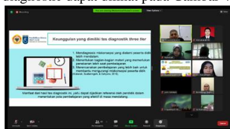
Gambar 4 Pemaparan Terkait Tes Diagnostik

Sehubungan dengan miskonsepsi, Hasil penelitian Utami et al. (2017) menunjukkan model pembelajaran CCT dapat direkomendasikan sebagai alternatif untuk meningkatkan kualitas pembelajaran kimia, memperbaiki model mental peserta didik, dan mereduksi miskonsepsi. Berikut dokumentasi pemaparan terkait tes diagnostic dapat dilihat pada Gambar 4.