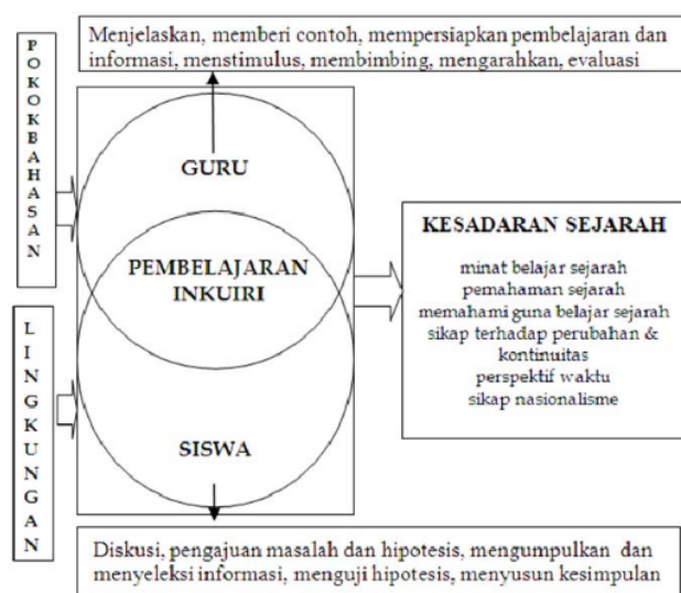
Gambar 1. Bagan Model Pembelajaran untuk Meningkatkan Kesadaran Sejarah

dilakukan pada data hasil observasi kelas untuk melihat gambaran efektifitas model, sedangkan analisis kuantitatif dengan uji t untuk membandingkan kemampuan siswa dan kesadaran sejarah pretest dan posttest antara kelompok eksperimen dan kelompok kontrol. Analisis Varian digunakan untuk membandingkan kemampuan dan kesadaran sejarah siswa berdasarkan kategori etak sekolah. Analisis kuantitatif dalam penelitian ini menggunakan bantuan program SPSS.