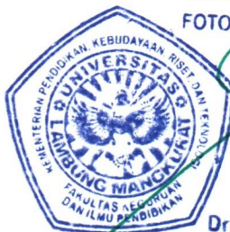
FOTO KOPISESUAI DENGAN ASLINYA DEKAN FKIP - ULM