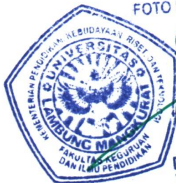
FOTO KOPI SESUAI DENGAN ASLINYA DEKAN FKIP - ULM