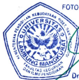
FOTO KOPI SESUAI DENGAN ASLINYA DEKAN FKIP - ULM