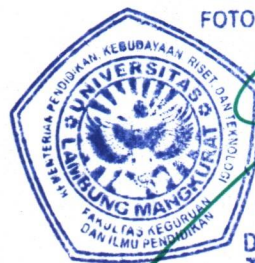
FOTO KOPI SEBUAI DENGAN ASLINYA DEKAN FKIP - ULM