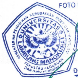
FOTO KOPI SESUAI DENGAN ASLINYA DEKAN FKIP - ULM