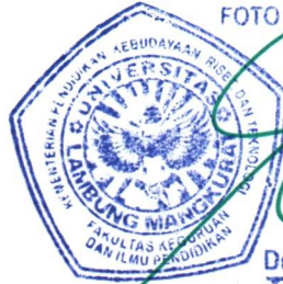
FOTO KOPI SÉSUAI DENGAN ASLINYA DEKAN FKIP - ULM