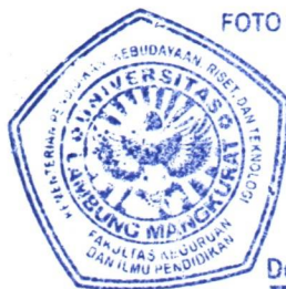
FOTO KOPI SESUAI DENGAN ASLINYA DEKAN FKIP - ULM