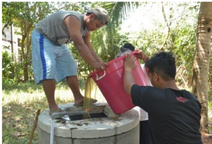
Gambar 5. Penuangan stater biogas