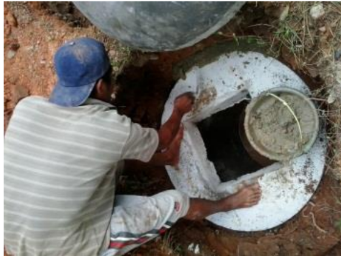
Gambar 4. Pemasangan Tutup lubang penampungan dan serapan