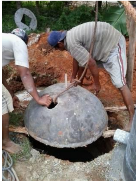
Gambar 2. Pemasangan tutup digester