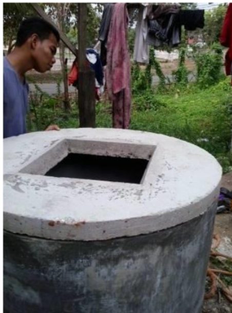
Gambar 3. Pemasangan Tutup Pengolahan sampah organik