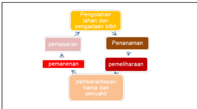
Gambar3. Skema Proses Pengelolaan Lahan Agroforestri Tradisional

Keempat pola yang di terapkan masyarakat Desa Paraduan untuk pengelolaan lahannya memiliki teknik atau cara yang sama. Rangkaian Kegiatan petani yang dilakukan untuk mengelola agroforestri tradisional meliputi pengelolakan tanah, pengadaan jumlah bibit yang bervariasi, penanaman, pemeliharaan tanaman, pemberantasan hama dan penyakit, pamanenan, dan pemasaran hasil. Uraian kegiatan pengelolaan tanaman pertanian dan kehutanan dapat dilihat pada Gambar 3.