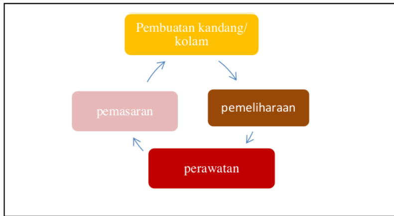
Gambar 4. Pengelolaan Peternakan dan Perikanan

Menurut wawancara dengan responden, jenis tanaman yang sering dijual ialah tanaman kopi karena masa panennya cepat yaitu setiap minggu sehingga lebih cepat untuk dijual dan mendapatkan pendapatannya. Perbedaan harga yang terjadi antara petani, agen, maupun pasar disebabkan karena beberapa faktor, factor yang sangat mempengaruhi ialah selisih keuntungan dan biaya transportasi untuk yang dekat maupun jauh. Dalam kegiatan peternakan dan perikanan yang dilakukan masyarakat Desa Paraduan adalah mulai dari pembuatan tempat (kandang, atau kolam untuk ikan), pemeliharaan, Perawatan, dan pemasaran. Uraian kegiatannya dapat dilihat pada Gambar 4.