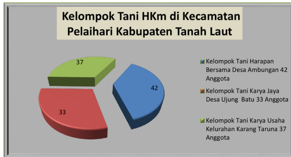
Gambar 3. Grafik analisa ketiga kelompok tani Hkm

Analisa Kelompok tani HKm di Kecamatan Pelaihari terdiri dari, kelompok Tani Harapan Bersama di Desa Ujung Batu, kelompok Tani Karya Jaya di Desa Ambungan dan kelompok Tani Karya Usaha di Kelurahan Karang Taruna dapat dilihat pada gambar 2 berikut