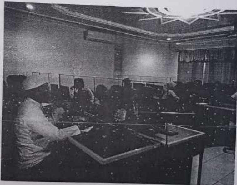
Gambar 4.1 Peserta Kegiatan PkM

Tim pengabdian kepada masyarakat kegiatan IbM Pelatihan Penelitian Tindakan Kelas (PTK) bagi Guru SMK Di Kota Banjarmasin berjumlah tiga orang, yang terdiri dari satu orang ketua dan dua orang anggota pelaksana. Baik ketua maupun anggota pelaksana memiliki keahlian di bidang pendidikan, khususnya mengenai Penelitian Tindakan Kelas (PTK). Kegiatan PkM ini dilaksanakan dengan acara tatap muka yang diselenggarakan di Laboratorium Al-Hasib, SMK Muhammadiyah 1 Banjarmasin pada hari Sabtu, tanggal 10 November 2018. Pertemuan ini dihadiri oleh 21 orang guru (daftar hadir peserta terlampir).