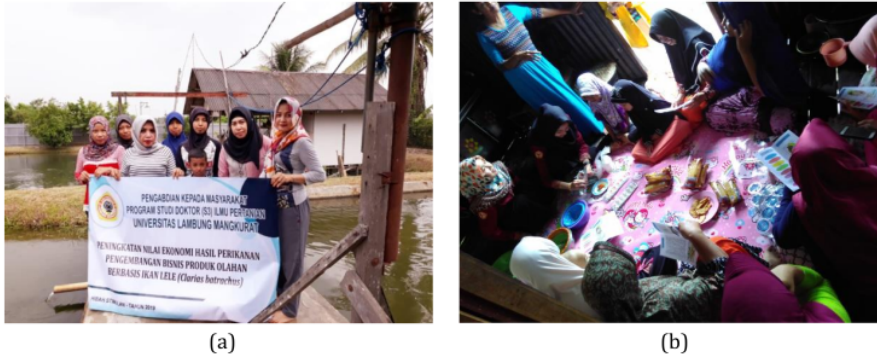
Gambar 1. Sosialisasi dan penyuluhan (a) Poklhasar Nila Anjani dan Tim Pengabdian (b) Kegiatan penyuluhan teknik pengolahan ikan

mendapatkan nilai selisih yang lebih tinggi. Pengolahan ikan lele menjadi nugget memberikan tambahan nilai yang nyata.