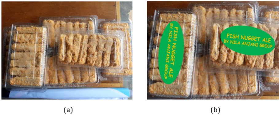
Gambar 3. Produk olahan ikan lele (a) pengemasan produk olahan (b) pelabelan produk "Fish Nugget Ale by Nila Anjani Group"