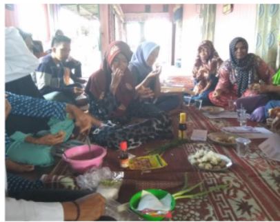
Gambar 2. Demonstrasi pengolahan ikan lele