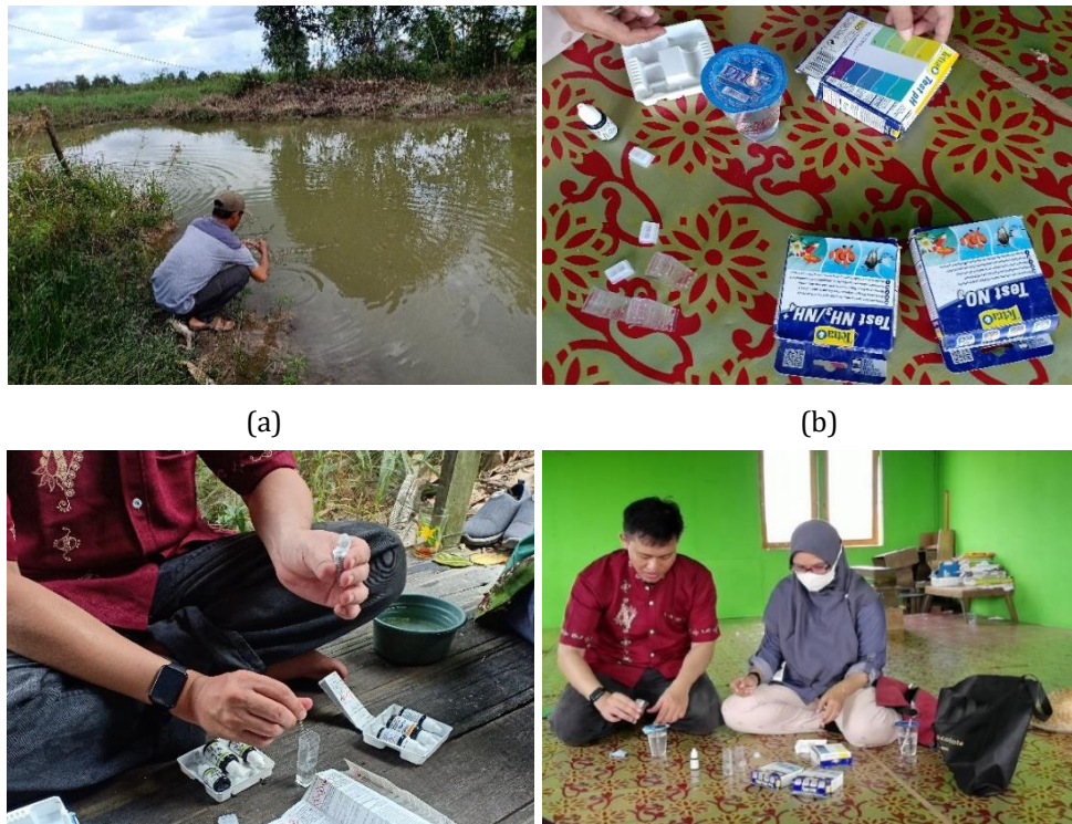
Gambar 3. Pengukuran kualitas air kolam budidaya ikan haruan (a) pengambilan sampel air (b) bahan dan indikator pengujian kualitas air (c) pengujian sampel air