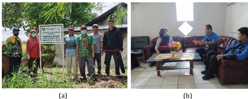
Gambar 1. Pertemuan dan konsultasi awal tim pengabdian dengan (a) Pokdakan Ramania Besar (b) Kepala Bidang Budidaya dan Staf Dinas Perikanan Kabupaten Tapin

Pelaksanaan PKM terdiri dari kegiatan persiapan, pelaksanaan, dan evaluasi kegiatan. Pada kegiatan persiapan diadakan pertemuan dan diskusi antara tim pengabdian dengan Kelompok Pembudidaya Ikan (Pokdakan) Ramania Besar di Desa Pabaungan Pantai, dan pihak Dinas Perikanan Kabupaten Tapin, khususnya bidang budidaya. Tujuan pertemuan ini adalah untuk telaah ulang kondisi usaha pemeliharaan ikan haruan yang dilakukan Pokdakan, koordinasi dan kesepakatan antar pihak yang akan terlibat, terutama kesediaan waktu anggota Pokdakan dan tempat pelaksanaan PKM (Gambar 1).