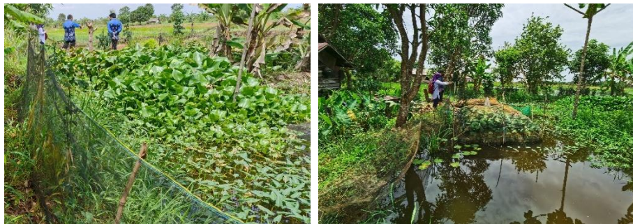
Gambar 5. Ledakan makrofita jenis enceng gondok pada kolam pembesaran ikan haruan akibat konsentrasi nitrat yang tinggi di Desa Pabaungan Pantai

Hasil pemantauan kadar ammonia di kolam sampel menunjukkan bahwa ammonia perairan budidaya masih berada di kisaran yang dapat ditoleransi ikan. Namun demikian, kadar ammonia perairan harus menjadi perhatian penting bagi pembudidaya seiring dengan intensifnya pengelolaan budidaya. Ammonia adalah produk ekskresi utama ikan yang dihasilkan dari katabolisme protein makanan dan diekskresi melalui insang sebagai ammonia tidak terionisasi (Ebeling et al., 2006). Ammonia yang tidak bermuatan ( \text{NH}_3 ) mudah larut dalam lemak sehingga mudah diserap tubuh dan mengganggu metabolisme ikan (Wahyuningsih & Gitarama, 2020). Ammonia dengan konsentrasi tinggi dapat menyebabkan suplai oksigen menurun dalam jumlah besar dan perubahan yang dapat berdampak buruk bagi ekosistem perairan (Jang et al., 2004). Ikan yang terpapar ammonia pada tingkat berlebihan akan mengalami gangguan ekskresi ammonia, sehingga proses penyerapan ammonia meningkat dan kematian (Sinha et al., 2012).