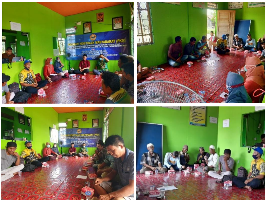
Gambar 2. Kegiatan penyuluhan pengelolaan kualitas air budidaya

kelompok mitra mendapatkan pendampingan dari tim pengabdian. Dengan demikian, kelompok mitra diharapkan nantinya dapat mempersiapkan, melaksanakan dan memantau kualitas air usaha kolam ikan haruannya secara mandiri, dan pada gilirannya akan berdampak terhadap produktivitas usaha kolam ikan haruan.