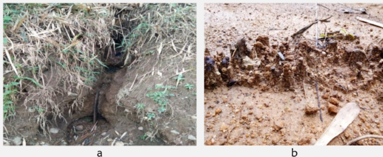
Gambar 4. Erosi yang ada di Lokasi Penelitian, a. Erosi alur, b. Erosi percik

Hasil pengamatan pada lokasi penelitian adalah ada 2 jenis erosi yaitu erosi percik dan erosi alur. Erosi alur adalah erosi yang terjadi akibat air yang mengalir berkumpul dalam suatu cekungan sehingga di cekungan tersebut terjadi erosi tanah yang lebih besar. Erosi percik adalah erosi yang disebabkan oleh adanya percikan air. Percikan tersebut berupa partikel tanah dalam jumlah yang kecil dan diendapkan ditempat lain. Erosi alur terdapat pada wilayah dengan tingkat bahaya erosi yang berat.