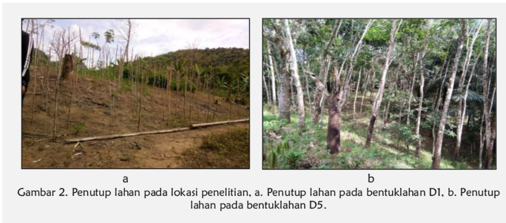
Gambar 2. Penutup lahan pada lokasi penelitian, a. Penutup lahan pada bentuklahan D1, b. Penutup lahan pada bentuklahan D5.

Berdasarkan nilai faktor CP, maka dapat dianalisa bahwa daerah penelitian dengan penggunaan lahan berupa perkebunan dan hutan. Kebun yang ada di lokasi penelitian adalah kebun cabe, kebun karet, dan kebun campuran yang mempunyai penutup tanah yang tidak rapat. Pada lokasi penelitian juga masih terdapat lahan kosong yang tidak ditanami dan hanya sedikit ditumbuhi vegetasi penutup tanah. Adanya vegetasi penutup lahan yang baik seperti rumput yang tebal dan hutan yang lebat dapat menghilangkan pengaruh topografi terhadap erosi sehingga erosi yang terjadi kecil sebaliknya penutup lahan yang jarang dapat menyebabkan terjadinya erosi yang tinggi. Kehilangan tanah dapat disebabkan oleh adanya lereng yang curam dan tutupan vegetasi yang rusak (El Jazouli et al., 2017).