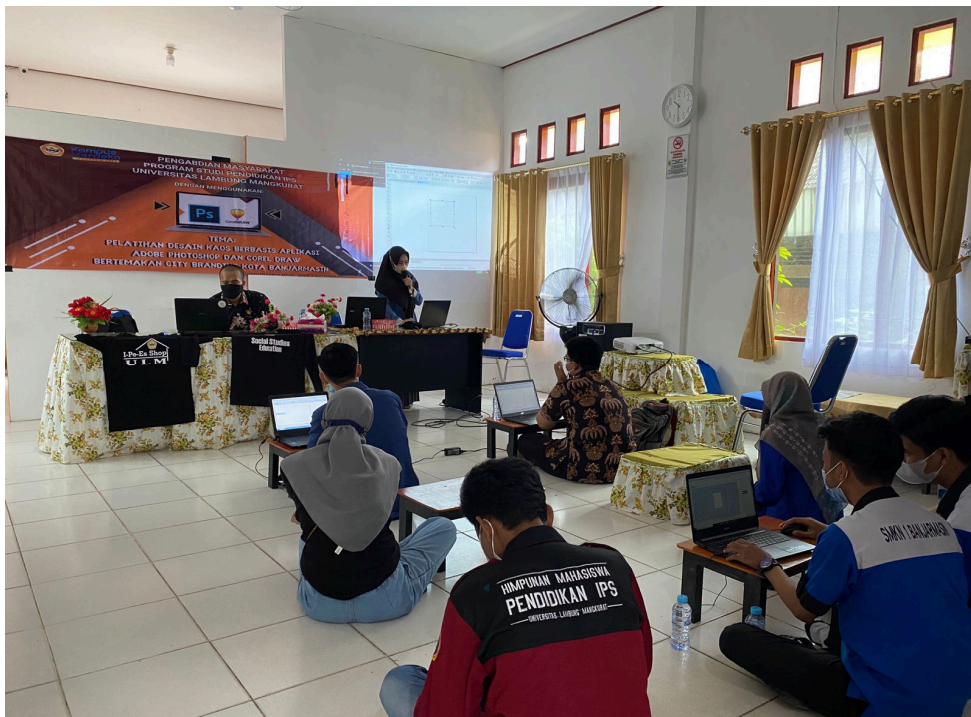
Foto Kegiatan Pelatihan