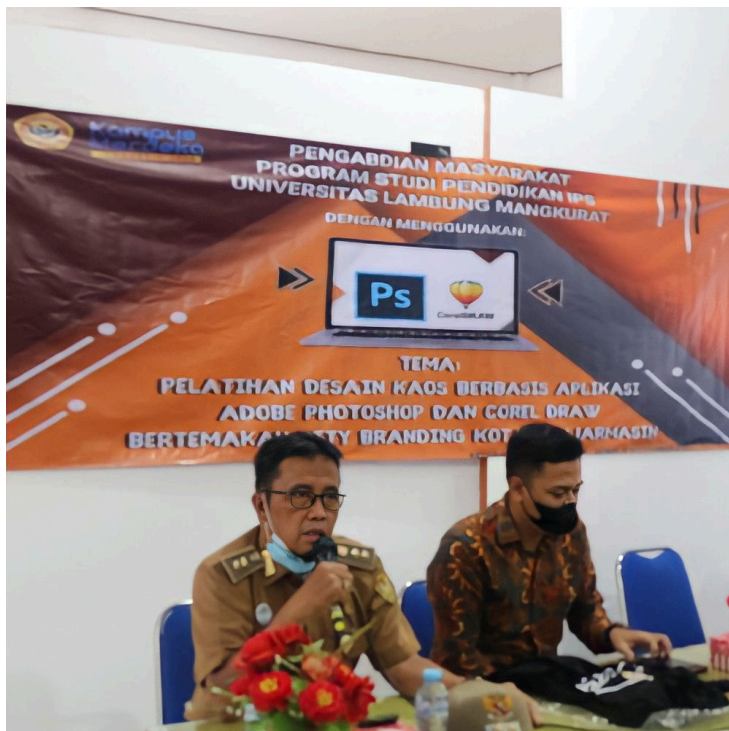
Foto Bersama Lurah Banua Anyar