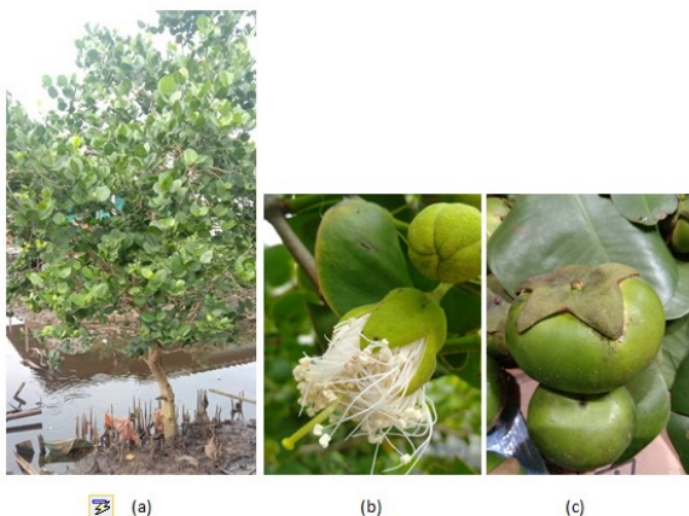
Gambar 1. Pohon (a), bunga (b), buah (c) Sonneratia ovata Back.