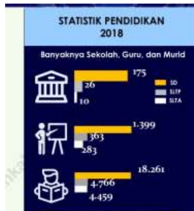
Gambar 3.1 Badan Pusat Statistik Kabupaten Tapin

artinya secara rata-rata penduduk Tapin bersekolah hanya sampai dengan kelas 2 SLTP. Angka tersebut secara tidak langsung mengisyaratkan bahwa penduduk Tapin terutama yang masih berada dibawah umur atau bisa dikategorikan sebagai anak lebih memilih untuk bekerja.