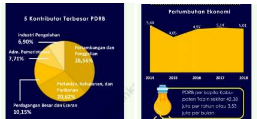
Gambar 2.1 Badan Pusat Statistik Kabupaten Tapin

Di Provinsi Kalimantan Selatan khususnya Kabupaten Tapin berdasarkan dari data Badan Pusat Statistik yang terbaru menyebutkan bahwa pada tahun 2018 pertumbuhan ekonomi Kabupaten Tapin mengalami penurunan dibanding tahun-tahun sebelumnya. Tahun 2018 perekonomian Kabupaten Tapin tumbuh sebesar 5,01 persen.