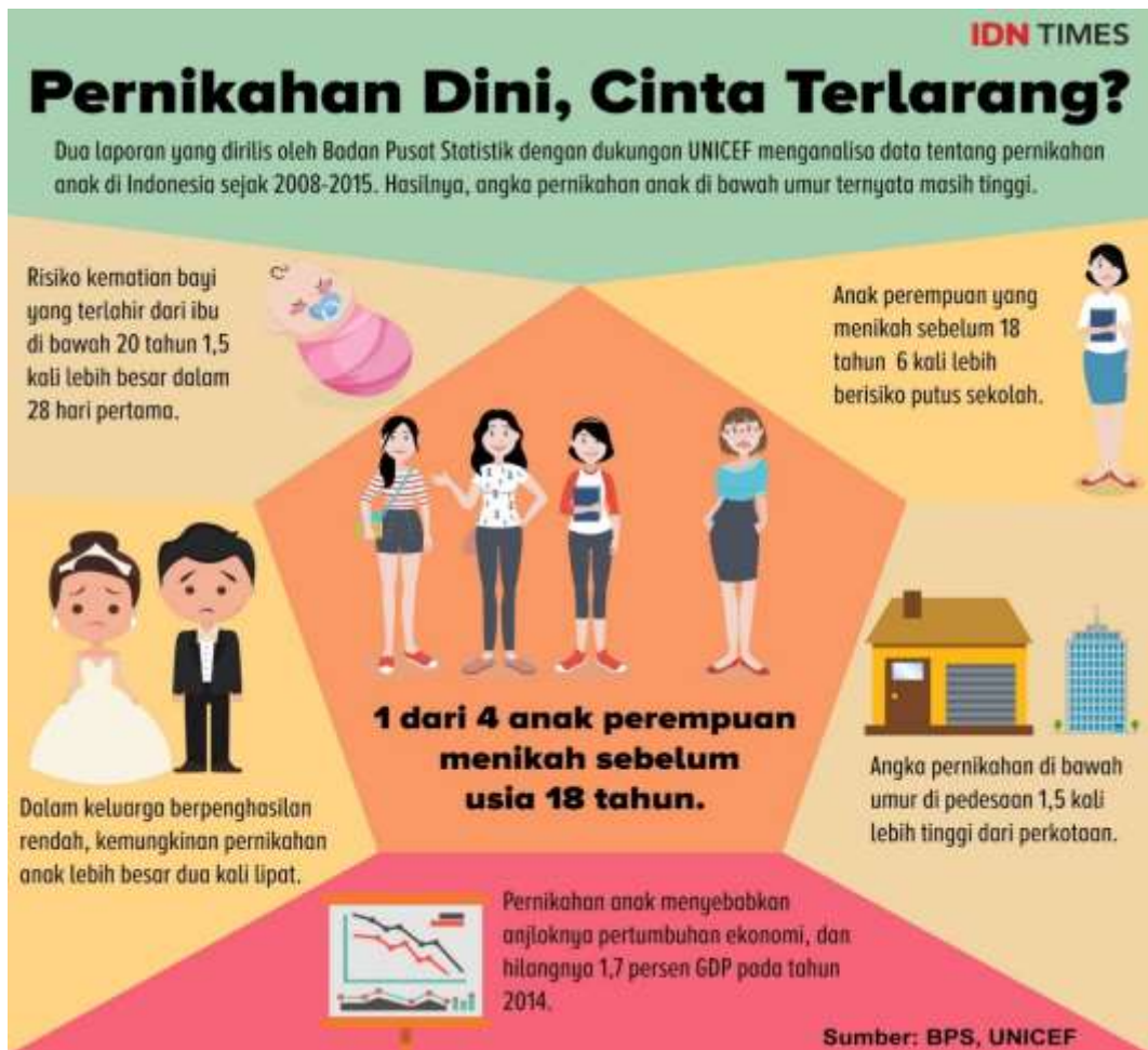
Gambar 3.2 Resiko Pernikahan Anak

Kemudian, meningkatkan kapasitas dan peran Forum Anak Daerah sebagai pelopor dan pelapor dan meningkatkan pula peran Pusat Pembelajaran Keluarga. Kementerian Pemberdayaan Perempuan dan Anak juga memfasilitasi daerah untuk mewujudkan Indonesia Layak Anak (IDOLA) 2030 melalui Kabupaten/Kota Layak Anak. 48